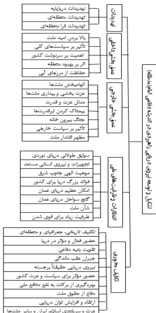
شکل (۲) شبکه مضمونی تشکیل و توسعه نیروی دریایی راهبردی در اندیشه دفاعی امام المسلمین (مدظله العالی)

محتوای CVI پژوهش ۰/۸۵ تعیین گردید؛ که نشان دهنده روایی بالا و قابل قبول می‌باشد. برای پایایی نیز با استفاده از روش کنترل اعضا؛ محقق متن تدابیر و رهنمودهای فرمانده معظم کل قوا (مدظله) را چندین مرتبه مرور نموده تا بتوانند مضامین پنج‌گانه را احضا نماید. براساس فرایند صورت گرفته شبکه مضمون پژوهش به شرح زیر ترسیم گردید: