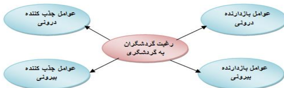
شکل (۱) مدل مفهومی تحقیق